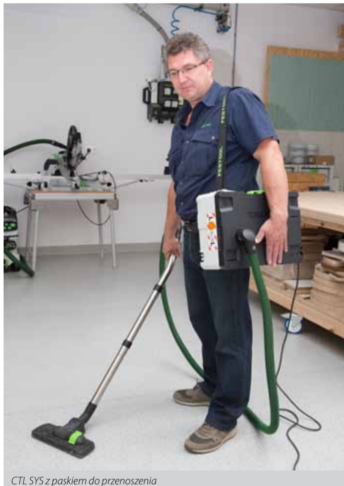
CTL SYS z paskiem do przenoszenia