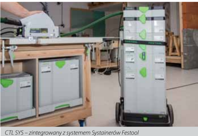
CTL SYS – zintegrowany z systemem Systemainerów Festool