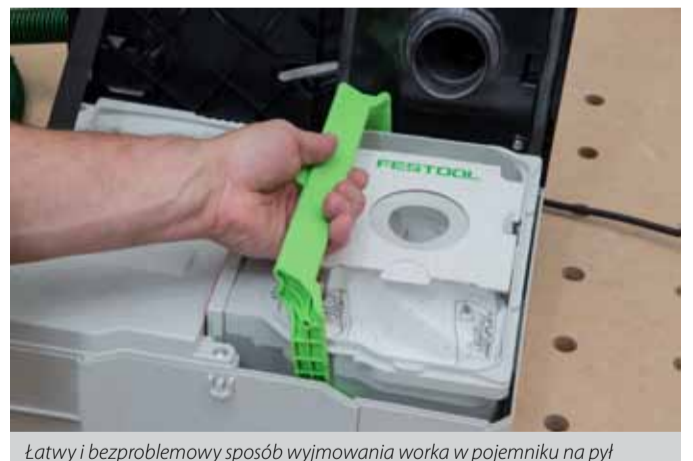
Łatwy i bezproblemowy sposób wyjmowania worka w pojemniku na pył