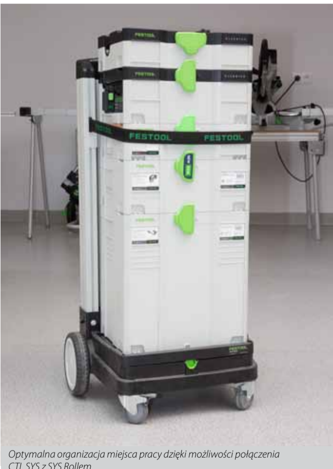
Optymalna organizacja miejsca pracy dzięki możliwości połączenia CTL SYS z SYS Rollem