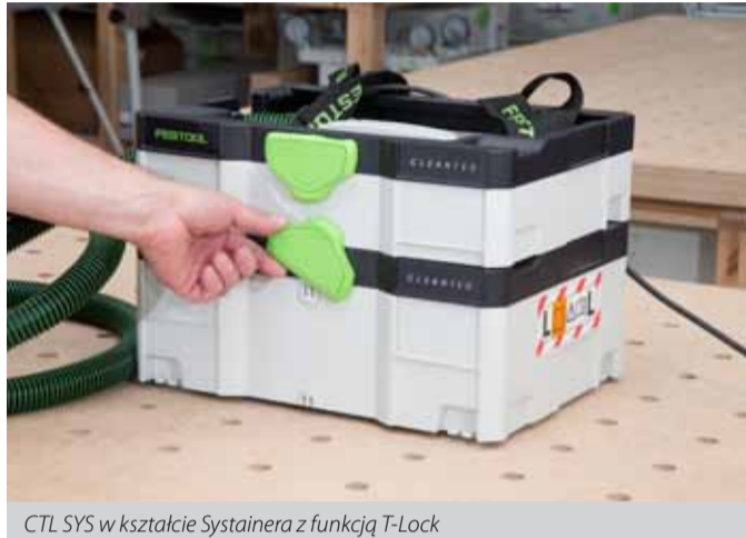
CTL SYS w kształcie Systemainera z funkcją T-Lock