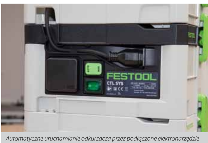
Automatyczne uruchamianie odkurzacza przez podłączone elektronarzędzie