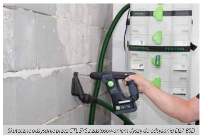
Skuteczne odsysanie przez CTL SYS z zastosowaniem dyszy do odsysania D27-BSD