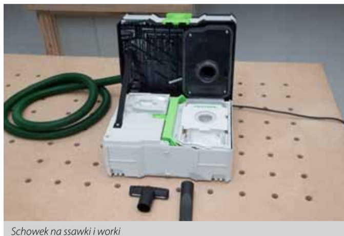
Schówek na ssawki i worki