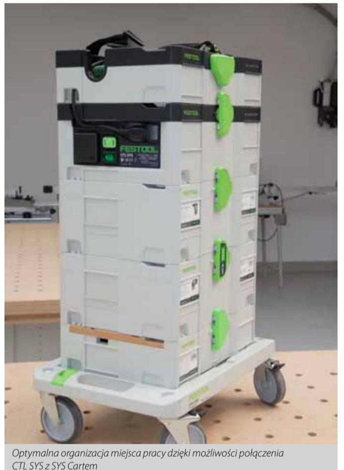
Optymalna organizacja miejsca pracy dzięki możliwości połączenia CTL SYS z SYS Cartem