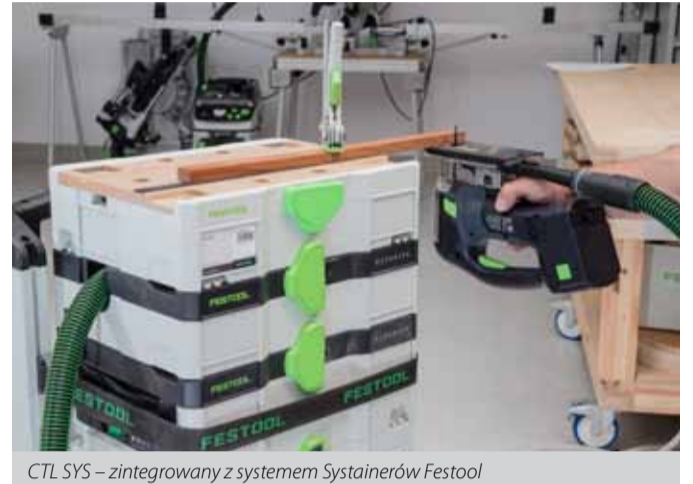
CTL SYS – zintegrowany z systemem Systemainerów Festool