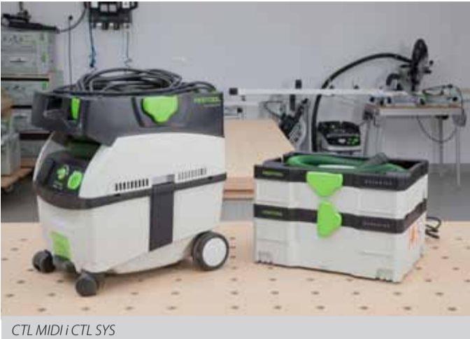
CTL MIDI i CTL SYS